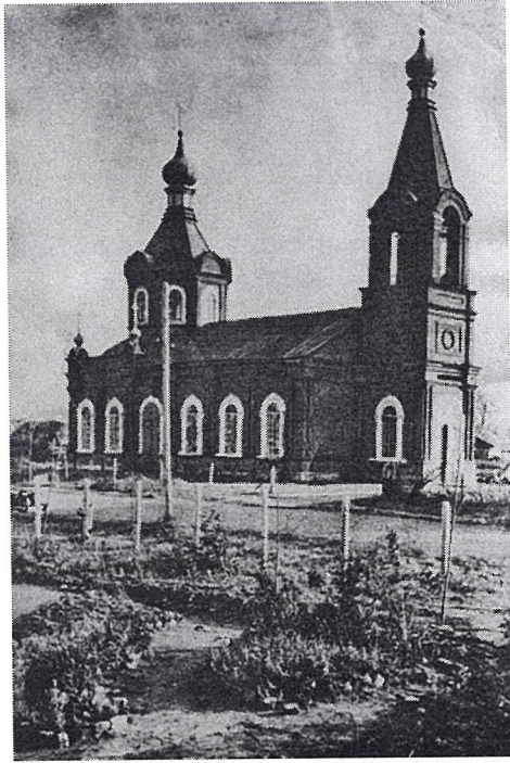
Покровская церковь. Послевоенная фотография