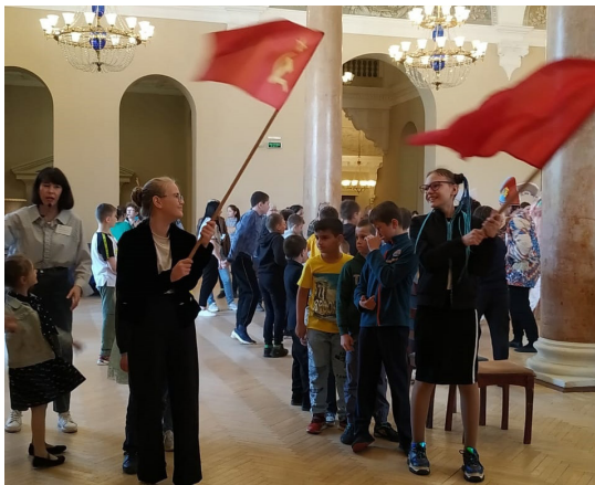
Интерактивное занятие в Тверском академическом театре драмы

Благодаря правильно поставленным акцентам, сотрудникам отдела удалось через игру расширить кругозор школьников, научить их работать в команде, многим дать возможность проявить свои таланты и сделать отдых детей в летнем лагере более ярким и запоминающимся.