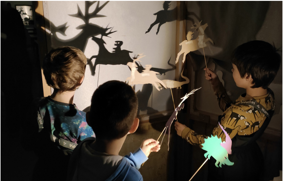
Дети разыгрывают теневой спектакль

Для того, чтобы полученный результат был зрелищным приятным и успешным, необходим режиссер, который «соберет» игру разных детей актеров в единое представление, определит продолжительность показа и темп действия, придумает световые эффекты, подберет музыку для показа, создаст общий сценарий. Для того, чтобы дети слаженно играли теневыми куклами, необходимы долгие и постоянные репетиции, как в настоящем взрослом театре, ведь как правило, играя на изнанке экрана, дети не видят результата своих усилий. И общий «рисунок» спектакля может сделать лишь сторонний наблюдатель – взрослый человек, режиссер-постановщик или руководитель студии. Вольные актерские импровизации детей-исполнителей будут возможны лишь после автоматически усвоенной общей последовательности действий, «сыгранности», а это большой серьезный труд. Оформление спектакля, общее художественное решение в этом случае лучше всего доверить художнику, сосредоточившись лишь на актерской игре маленьких студийцев. Актерская работа хорошо развивает их язык, литературную речь, взаимодействие, может служить в некотором роде терапевтическим действием для детей застенчивых и робких, ведь при игре их не будут видеть, и это раскрепощает. Спектакль можно показывать родителям, посетителям музея на праздниках и тематических мероприятиях. Возможна организация гастролей, участие в фестивалях. Вполне достаточно будет в этом случае сделать всего пару спектаклей за год, но отточить их до блеска.