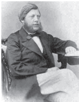
Статский советник В.Г. Коробьин

съезде тверские дворяне составили адрес императору с протестом против сохранения сословных привилегий, которые лишь обострили социальные противоречия. В знак солидарности с решением съезда кандидаты от правительства в составе Тверского губернского по крестьянским делам присутствия Н.А. Бакунин и А.Н. Толстой подали в отставку 6 февраля 1862 года.