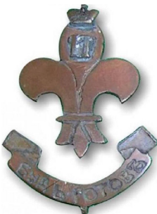
Значки скаутов Российской империи, начало XX века

Открытки с русскими скаутами «Будь готов оказать помощь слабому», 1915 г.