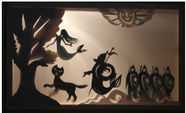
Теновой сюжет по поэме А.С. Пушкина «Руслан и Людмила»