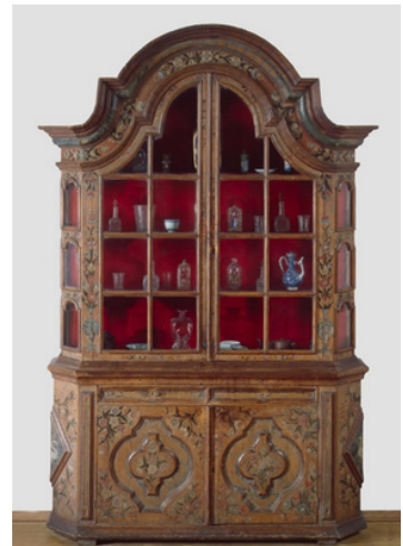
Горка-поставец, первая четверть XVIII в., Государственный Эрмитаж