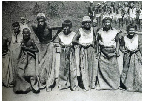
Спортивные соревнования. Бег в мешках