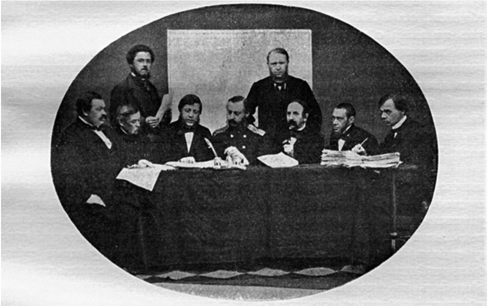
Тверское губернское по крестьянским делам присутствие (1862-1864 гг.)