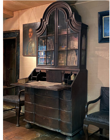
Кабинет-секретер, конец XVII – начало XVIII века, ГРМ

В ходе проведения атрибуции шкафа-поставца из Кашинского краеведческого музея