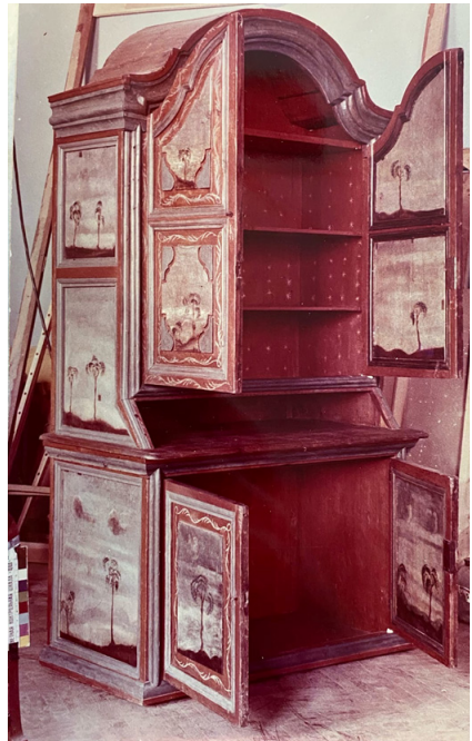
Шкаф-поставец после реставрации, 1900 г.

Стилистически шкаф-поставец близок к кабинету-секретеру конца XVII – начала XVIII века, находящемуся в домике Петра I (Государственный русский музей), а также к горке из собрания Государственного Эрмитажа. Оба предмета происходят от голландского прообраза-витрины с возвышающейся центральной частью, имеющей лучковый свод. Сам вид витрины, т.е. мебели, предназначенной для того, чтобы хранить внутри неё предметы на полках, происходит от