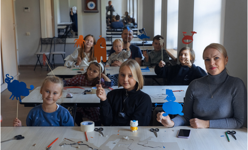
Дети и родители вместе создают теневые куклы

С развитием современных технологий, при достаточном обеспечении студии, существует множество возможностей дополнительных эффектов. Нельзя сказать, что идея соединения подвижных силуэтов и видеоискусства возникла только сейчас. Выдающимся мастером этого направления анимации была режиссер и художник Лотта Райнигер. В современном кинематографе подобного стиля придерживаются Мишель Оселоу и Энтони Лукас. В более ранней версии силуэтного мультфильма киносъёмка проводилась методом «перекладушек», когда фигурки из бумаги клали на горизонтальное стекло и каждое мелкое изменение расположение деталей, дающее движение, фиксировалось отдельным кадром. Это была практически ручная работа. Для одной секунды экранного движения было необходимо 6 кадров. Потом кадры соединялись в движение. Так работала Райнигер. Существовал и классический метод отрисовки силуэтов, при которых они двигались и в отличие от перекладного метода были очень пластичными, могли менять свою форму. Сейчас в такой технике работает Джаспер Морреллоу. С современными компьютерными программами анимации делать мультфильмы несколько легче. Как вариант, возможно сотрудничество теневой студии и студии анимации, в результате которой дети смогут играть теневыми куклами не только офлайн, но и в видеозаписи короткого мультфильма.